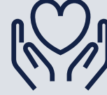
Yardımlar ve hayırsever bağışlar